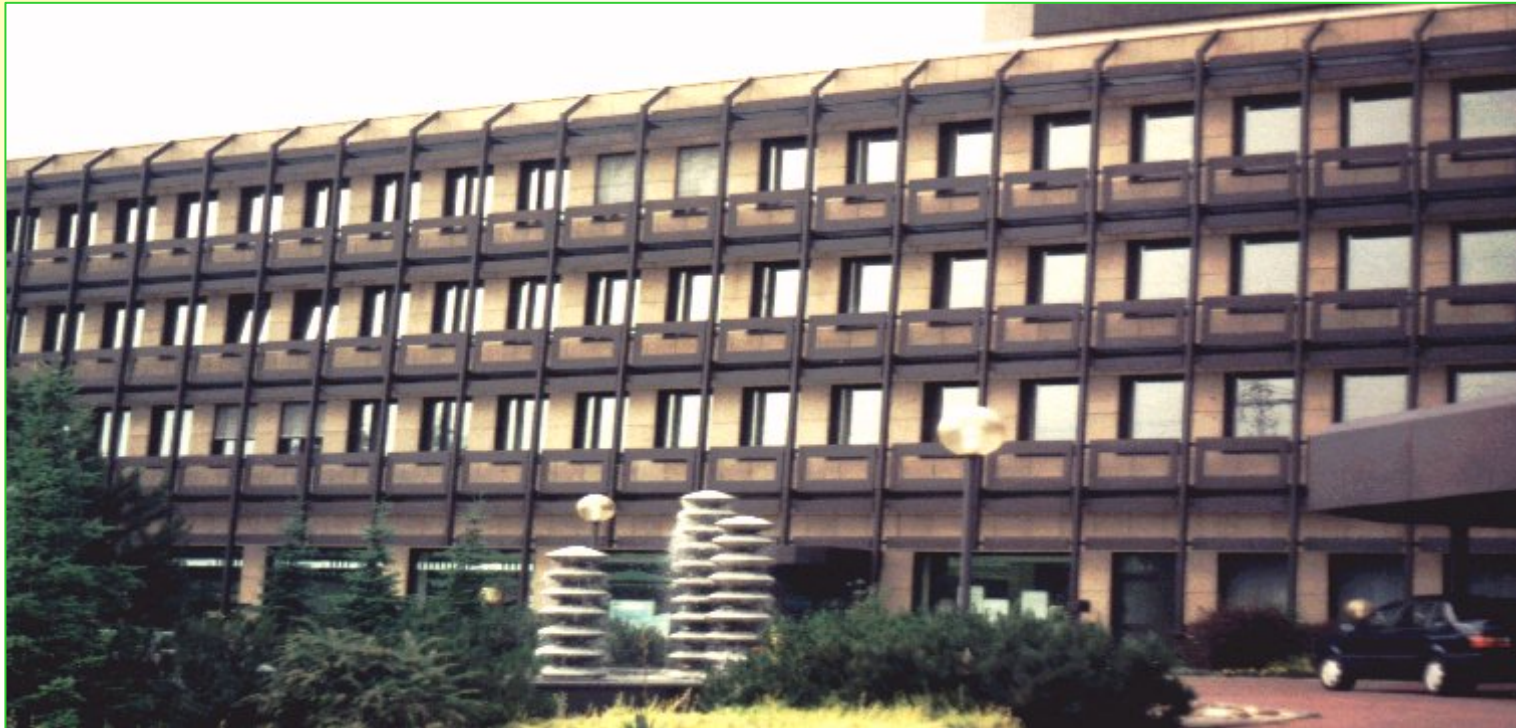
Verwaltungsgebäude der RWE Energie AG in Saffig bei Koblenz (Teilansicht)