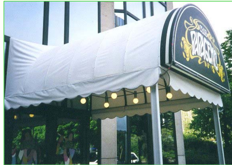
Nach der Reinigung

Untergrundschonende und umweltfreundliche Reinigung aller Untergrundarten z.B. Naturstein- Kunststein- Klinker- Glas- und Metallfassaden